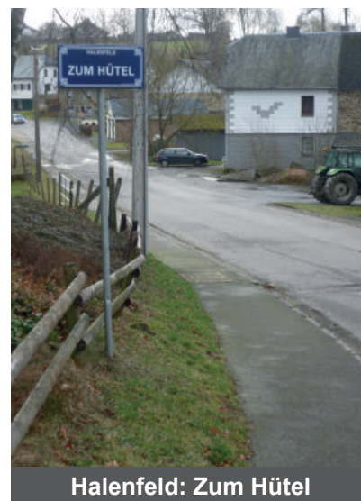
Halenfeld: Zum Hütel