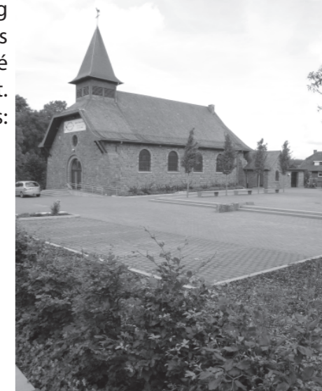
Der Dorfplatz in Schoppen wird am 26. August 2012 eingeweiht.