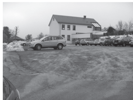
In Schoppen entsteht zwischen Kirche und Schule ein neuer Dorfplatz.