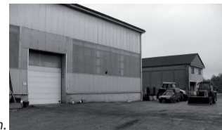
Der kommunale Bauhof in den ehemaligen Viehmarkthallen.

Die architektonischen Planungen zum Umbau des kommunalen Bauhofes laufen in diesem Jahr an. Die Verwirklichung des Projektes ist ab 2012 vorgesehen. Die Deutschsprachige Gemeinschaft unterstützt das Vorhaben mit einem Zuschuss von 60%.