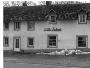
Die alte Schule in Deidenberg bekommt ein neues Dach.

Eine letzte Maßnahme im Hochbau betrifft die Instandsetzung von vier ehemaligen Gendarmeriewohnungen in Amel. Kosten: 110.000 €. Zuschuss der Wallonischen Region: 124.500 € (für Ankauf und Renovierung).