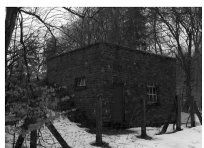
Die Brunnen im Wolfsbusch werden im Herbst 2010/Frühjahr 2011 an das Wasserleitungsnetz angeschlossen.

Dem Infoblatt ist eine Beilage zum Thema Brennholz, Stangenholz und Rallye beigelegt.