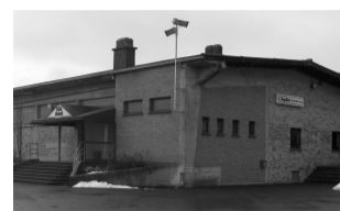
Die Isolationsmaßnahmen betreffen auch die beiden Turnhallen.

Bereits in diesem und im nächsten Jahr werden die 9 Heizkessel, die den gesamten ehemaligen Molkereikomplex (heute Feuerwehrkaserne, Rotes Kreuz, ÖSHZ, Wasserdienst, UVIB, Kreativa), die beiden Turnhallen und den gesamten Bauhof beheizen, durch eine zentrale Pelletsheizung ersetzt. Ferner werden Isolationsmaßnahmen an verschiedenen Dächern und Fenstern vorgenommen. Kosten: 554.180 €. Davon übernimmt die Wallonische Region 385.000 €, die Deutschsprachige Gemeinschaft 113.762 € und die Gemeinde Amel 55.418 € (=10%).