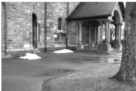
Der Kirchenbering in Medell wird saniert.

Der Kirchenbering in Medell wird in diesem Jahr ebenfalls erneuert. Die Materialkosten sind mit 40.000 € veranschlagt, die Arbeiten werden durch den Arbeiterdienst der Gemeinde verrichtet. Dabei wird der Eingang der Kirche Medell mit Beihilfen der DG behindertengerecht gestaltet (Hebevorrichtung).